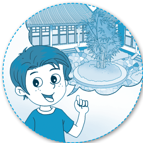
说故事 shuō gùshi