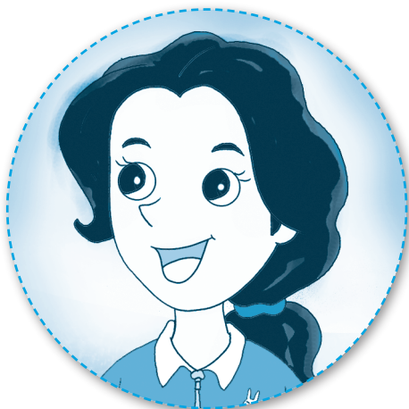
帮老师 bāng lǎoshī