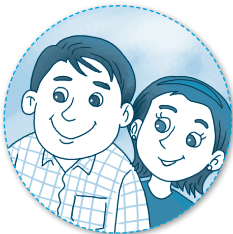
帮父母 bāng fùmǔ