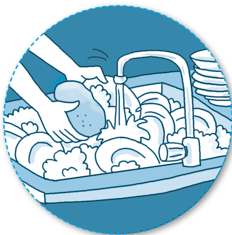
做家务 zuò jiāshì